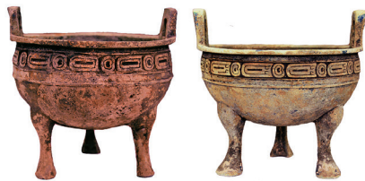
图1 夏饷铺M3鼎(左)及M100鼎(右)基于成分的外观呈色效果渲染图

在夏饷铺四组高等级墓葬中, 年代最早的是M6、M5组, 为两周之际至春秋初年。M6出土的立耳球腹弦纹鼎, 颈部微束、腹底较平、三足内聚, 是春秋早期常见的器形, 与部分西周晚期器物, 如岐山董家村窖藏所出善夫伯辛父鼎较为接近 [13] 。M6出土的环形倮