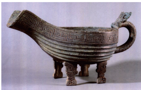
图4 信阳杨河番昶伯者君匜