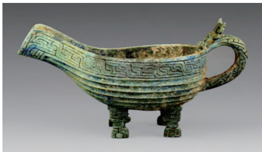
图3 南阳夏饷铺铜匜(M16)